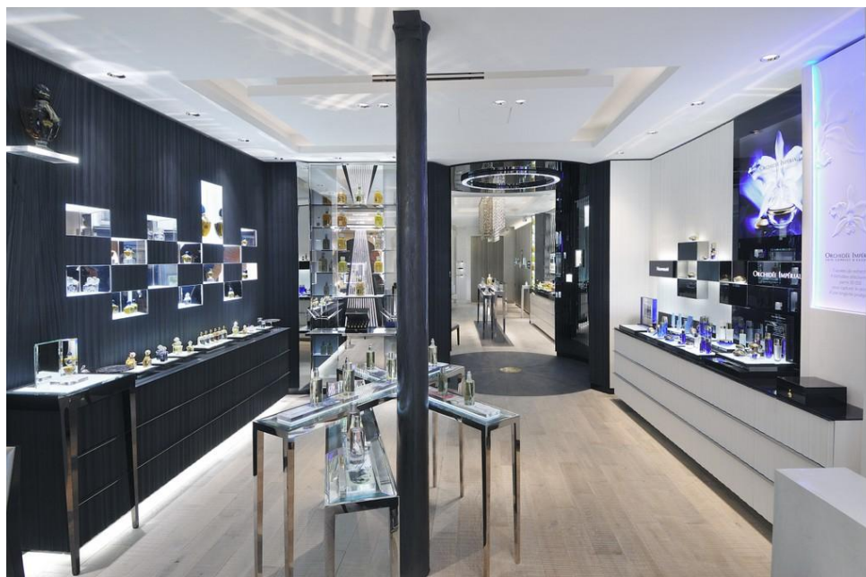
Boutique Guerlain Francs Bourgeois